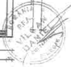
PLAN ETAJ 2 Scara 1:100